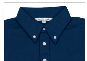
ボタンダウン仕様