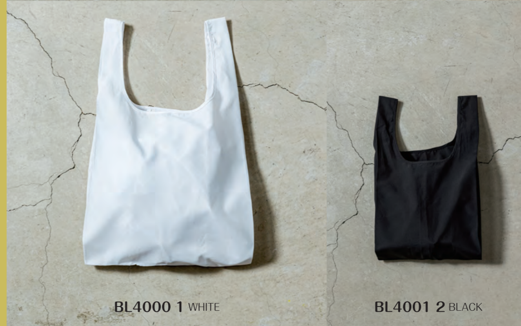
BL4001 2 BLACK