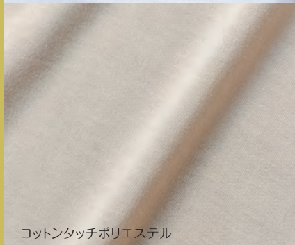
コットンタッチポリエステル