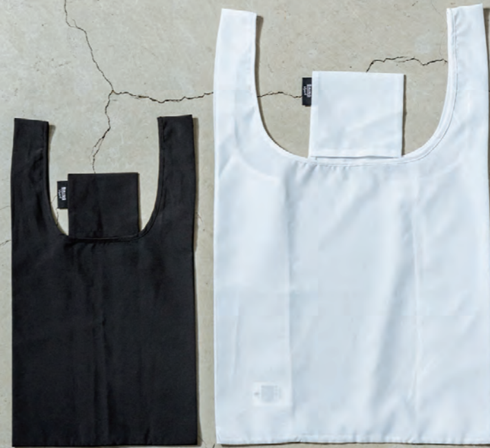
BL4000 1 WHITE