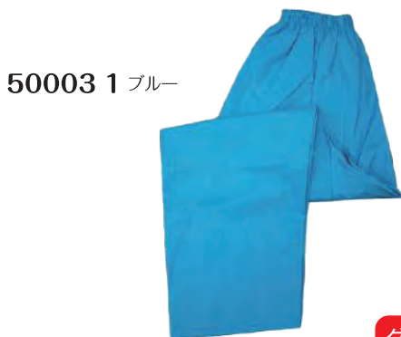
50003 1 ブルー