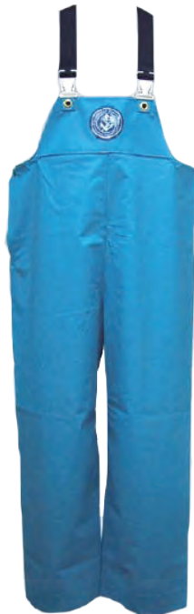
50002 1 ブルー