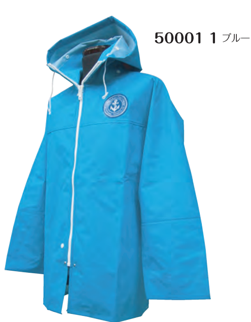
50001 1 ブルー

しなやかで柔らかいので動きやすく、着やすさを追求したデザインに、ウェルダーク縫製による完璧な防水性を備えています。表面は高重合度配合塩化ビニール樹脂を使用し、耐寒性・耐油性に優れ、裏面はポリエステル100%基布を使用し、衣料タッチで吸湿性に富んでいます。