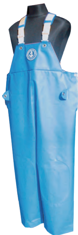
52002 1 ブルー