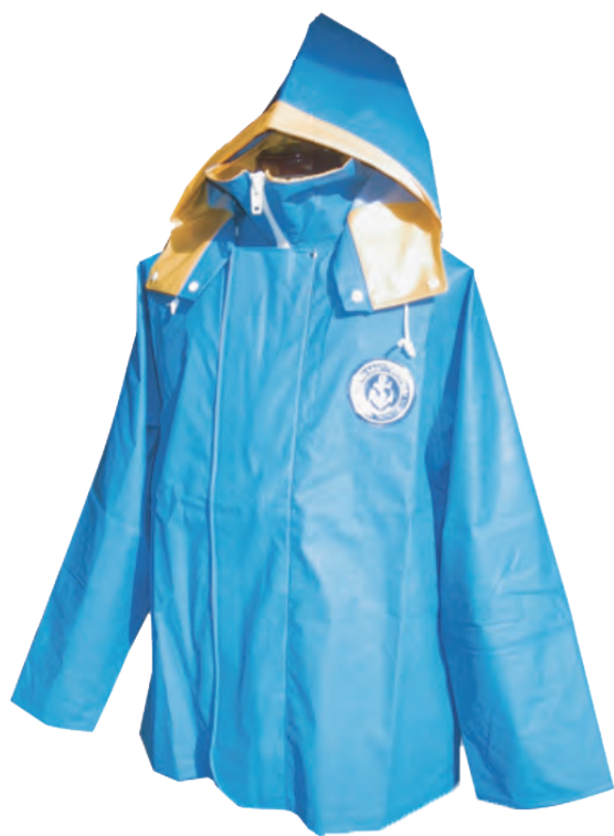
52001 1 ブルー

よりプロの方にオススメしたい。作業で消耗が激しい胸付ズボンの厚みを0.6mmにすることで強化。ウェルダーク縫製による完璧な防水性。表面は高重合度塩化ビニール樹脂を使用し、耐寒性・耐油性に優れ、裏面はポリエステル100%基布を使用し、衣料タッチで吸湿性に富んでいます。