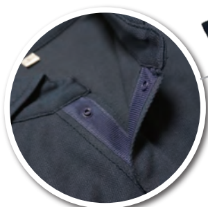
ボタン脱落防止のドットボタン