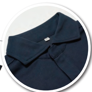
衿は水平カラーを採用