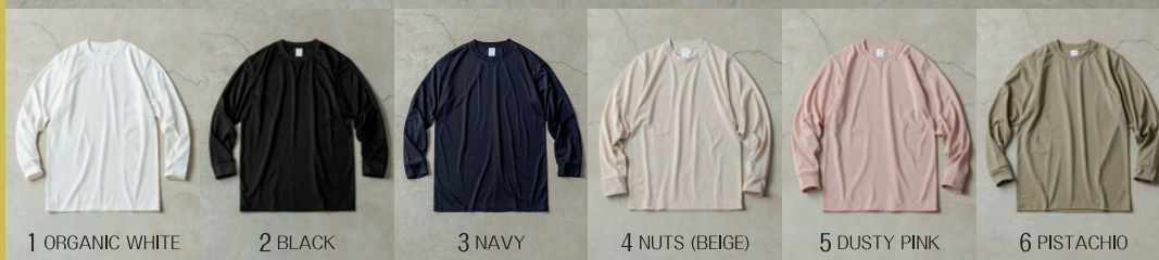
1 ORGANIC WHITE 2 BLACK 3 NAVY 4 NUTS (BEIGE) 5 DUSTY PINK 6 PISTACHIO