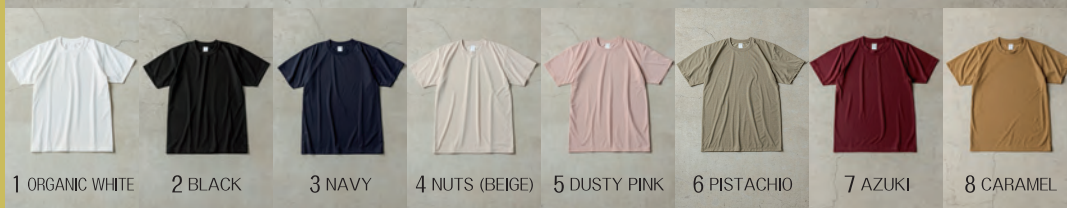
1 ORGANIC WHITE 2 BLACK 3 NAVY 4 NUTS (BEIGE) 5 DUSTY PINK 6 PISTACHIO 7 AZUKI 8 CARAMEL