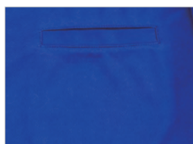
スリットポケット付(16950)