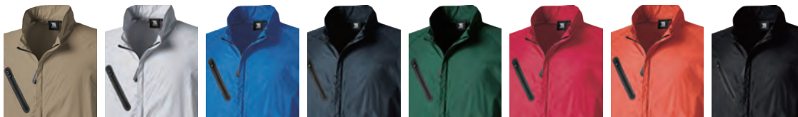
15 ベージュ 25 シルバークレー 41 ロイヤルブルー 45 ネイビー 55 グリーン 75 レッド 85 オレンジ 95 ブラック