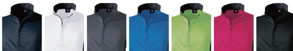
45 ネイビー 5 ホワイト 25 チャコールグレー 41 ロイヤルブルー 55 ライトグリーン 75 ワイン 95 ブラック

裾部分がパタつかない裾ストレッチバイピング仕様 襟部分を閉めても首にあたりにくい仕様