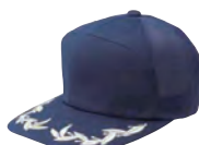
6031 ネイビー(シルバー刺繍) ● ■