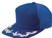
5841 ロイヤルブルー ■