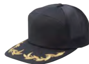
5891 ブラック ■