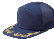
6131 ネイビー ● ■