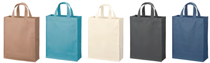
28 ベージュ 34 スモークブルー 50 アイボリー 9 ブラック 6 ネイビー