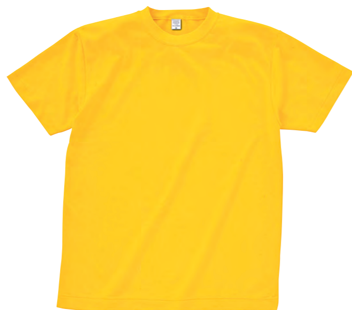
15850 9 イエロー