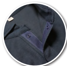
ボタン脱落防止のドットボタン