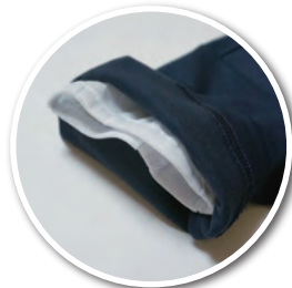
体毛落下防止の脇ネット