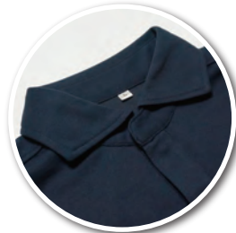
衿は水平カラーを採用