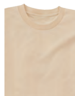
148 ホワイトスモーク