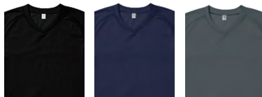
2 ブラック 3 ネイビー 11 グレー