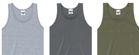
8 ハザーグレー 15 ダークグレー 42 アーミーグリーン