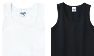
1 ホワイト 2 ブラック