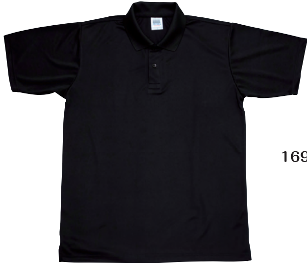
16900 2 ブラック