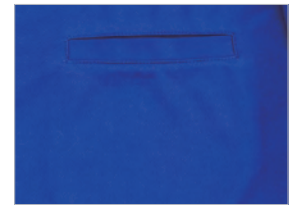
スリットポケット付(16950)