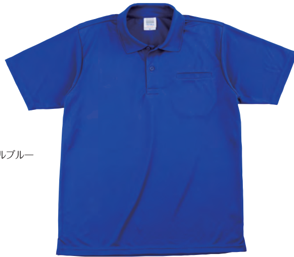
16950 4 ロイヤルブルー