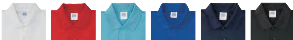
1 ホワイト 5 レッド 6 サックスブルー 4 ロイヤルブルー 3 ネイビー 2 ブラック