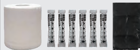
トイレトーパーの芯に凝固剤と汚物処理袋を収納

トイレトーパーは再生紙 1回分ずつアルミパックで密閉 100%使用で厚みのある4枚 された凝固剤は、高吸収ポリ 重ね。1巻15mで、20~25回 マー、抗菌剤、消臭剤入りで確 分使用可能 かな品質を確認済み