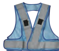
8 スカイブルー/シルバー