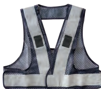
7 ネイビー/シルバー