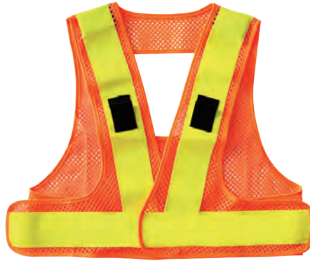
1 蛍光オレンジ/蛍光イエロー