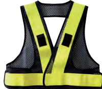
3 ネイビー/蛍光イエロー