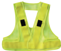
2 蛍光イエロー/蛍光イエロー