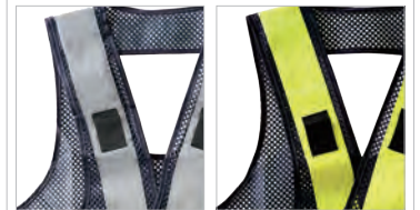
日中にオススメの 蛍光イエロー