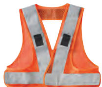
5 蛍光オレンジ/シルバー