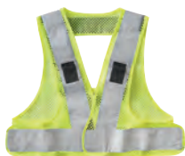
6 蛍光イエロー/シルバー