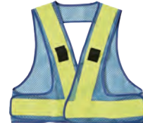
4 スカイブルー/蛍光イエロー