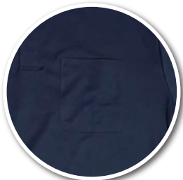
何かと便利なポケット付き