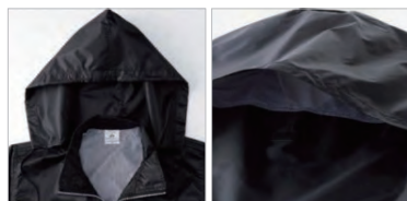
襟にフードを収納

ダイヤリップ生地を使用 一定の間隔で、太い糸を編みこむことによって、格子柄の生地になっています。デザイン性と共に、太い糸が生地の強度も増えています。