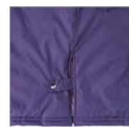
スリット調節機能