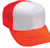
75 蛍光オレンジ コンビタイプ