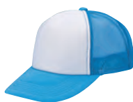
14 サックス×白 ●