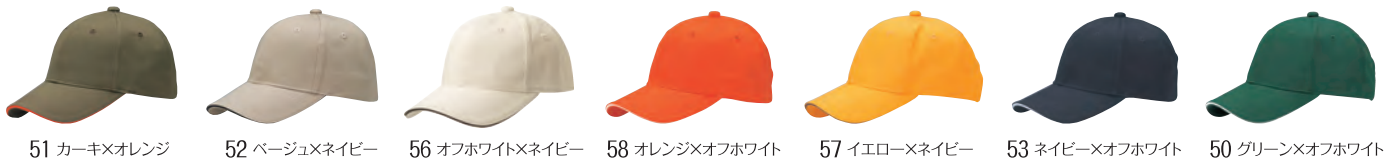
51 カーキ×オレンジ 52 ベージュ×ネイビー 56 オフホワイト×ネイビー 58 オレンジ×オフホワイト 57 イエロー×ネイビー 53 ネイビー×オフホワイト 50 グリーン×オフホワイト