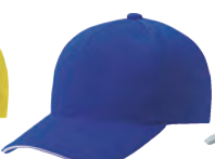
4 ロイヤルブルー×白