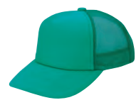
31 ノーサイグリーン