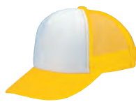
17 イエロー×白 ●