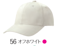
56 オフホワイト ●