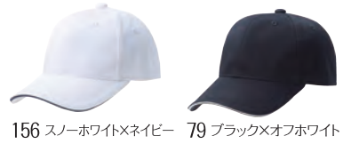
156 スノーホワイト×ネイビー 79 ブラック×オフホワイト