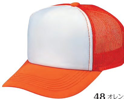
48 オレンジ×白 ●