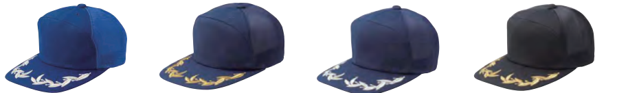
5841 ロイヤルブルー ■ 6131 ネイビー ● ■ 6031 ネイビー(シルバー刺繍) ● ■ 5891 ブラック ■