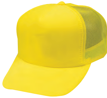
67 蛍光イエローモトーンタイプ