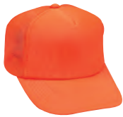
65 蛍光オレンジ モトーンタイプ