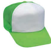
71 蛍光グリーン コンビタイプ