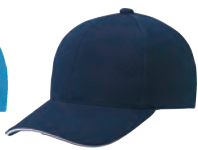
3 ネイビー×白 ●