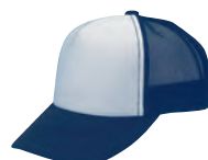
43 ネイビー×白 ●