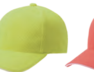
11 ライトグリーン×白