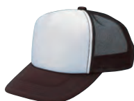
46 ブラウン×白 ●