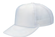
16 ホワイト×白 ●