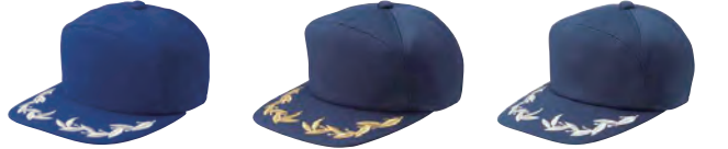
584 ロイヤルブルー 583 ネイビー ● 603 ネイビー(シルバー刺繍) ●