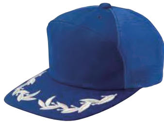
5841 ロイヤルブルー ■