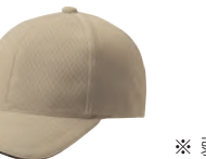
2 ベージュ×ネイビー