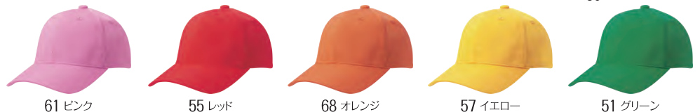
61 ピンク 55 レッド 68 オレンジ 57 イエロー 51 グリーン