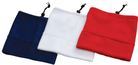
83 ネイビー 86 ホワイト 85 レッド