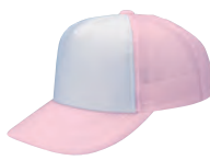
41 ピンク×白 ●