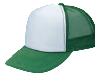
11 グリーン×白 ●