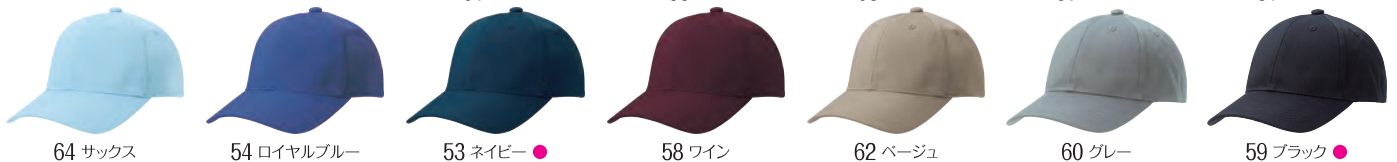
64 サックス 54 ロイヤルブルー 53 ネイビー ● 58 ワイン 62 ベージュ 60 グレー 59 ブラック ●