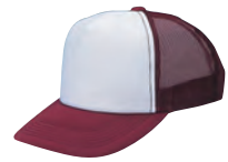
45 ワイン×白 ●