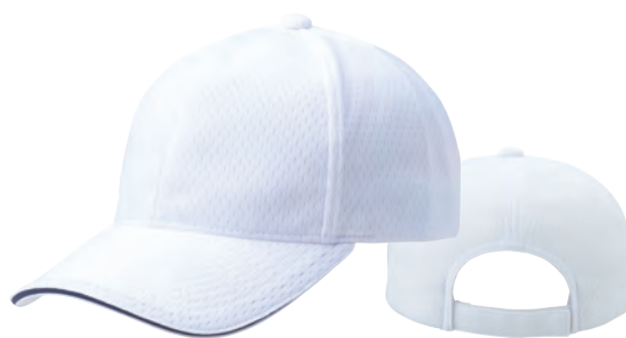
6 ホワイト×ネイビー ●