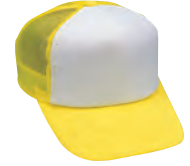
77 蛍光イエロー コンビタイプ