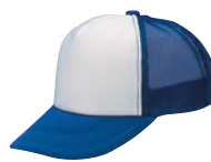
13 ロイヤルブルー×白 ●