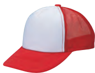
15 レッド×白 ●