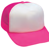
78 蛍光ピンク コンビタイプ