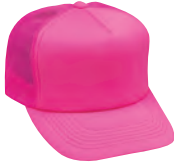
68 蛍光ピンク モトーンタイプ