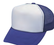
40 パープル×白 ●