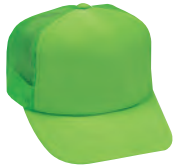
61 蛍光グリーン モトーンタイプ