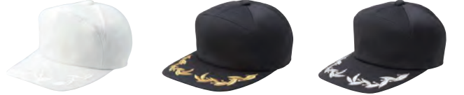
586 ホワイト 589 ブラック 503 ブラック(シルバー刺繍)