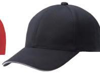
9 ブラック×白 ●