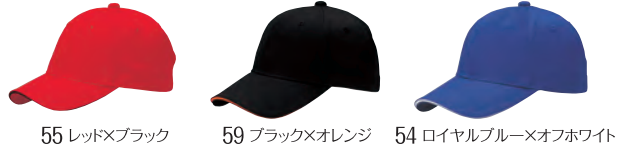
55 レッド×ブラック 59 ブラック×オレンジ 54 ロイヤルブルー×オフホワイト