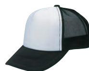
19 ブラック×白 ●