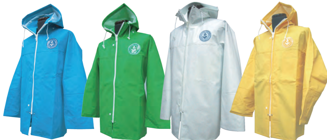
1 ブルー 2 グリーン 3 ホワイト 4 イエロー