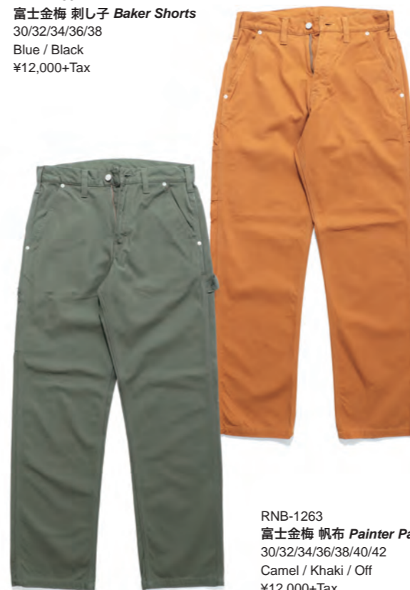
RNB-1263 富士金梅 帆布 Painter Pants 30/32/34/36/38/40/42 Camel / Khaki / Off ¥12,000+Tax